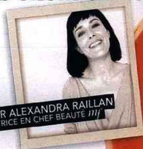
PAR ALEXANDRA RAILLAN RÉDACTRICE EN CHEF BEAUTE IIII

J'ASSURE MES ARRIÈRES Avant l'épreuve du maillot, je commence ma cure "belles fesses". (Wonderfess, Crème sculptante spécifique, Jeanne Piaubert) 69,50€ les 100 ml.)