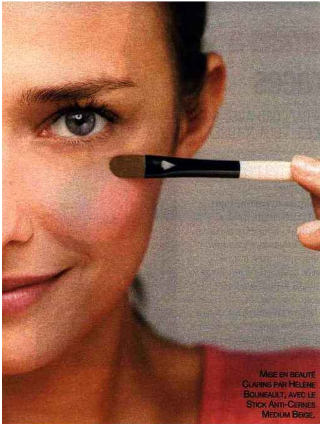
MISE EN BEAUTÉ CLARINS PAR HÉLÈNE BOURNEAULT, AVEC LE STICK ANTI-CERNES MEDIUM BEIGE.